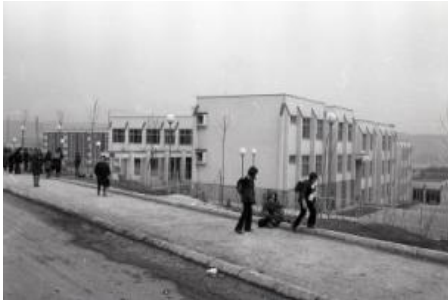
Изглед школе „3. октобар“ 1979. године

Школа је била одлично опремљена наставним средствима и дидактичким материјалом као и интерном телевизијом у боји.