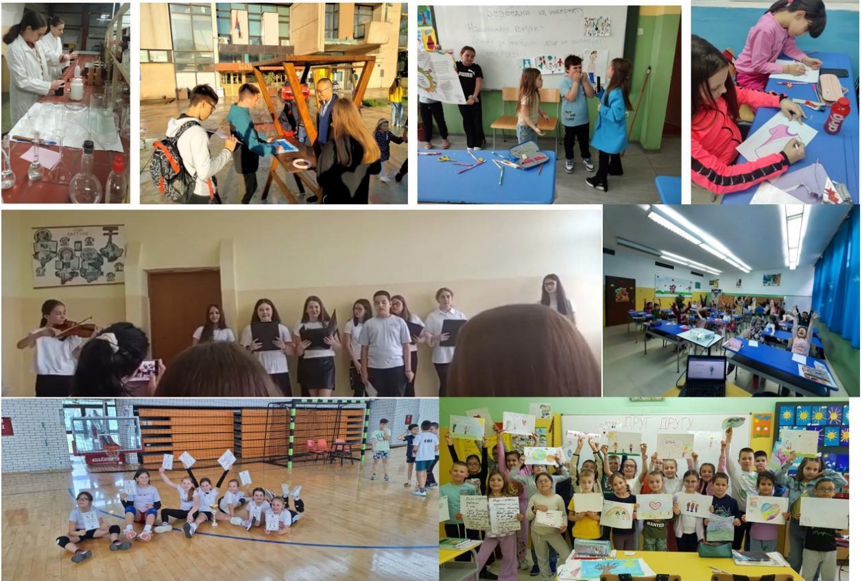
... и данас.