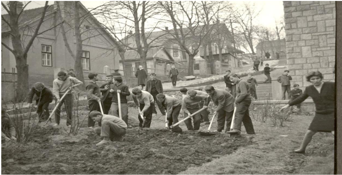
Рад секције некад (друштвено - користан рад) ...