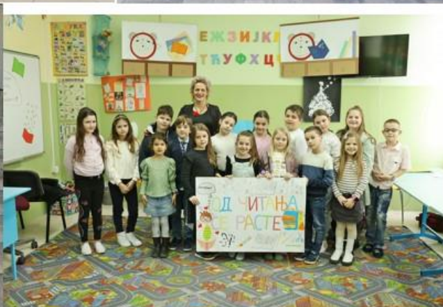
Заједно на истом задатку: наставници и ученици