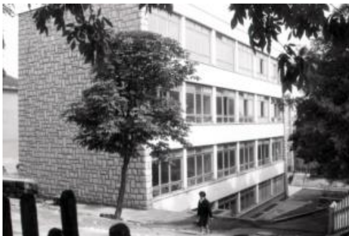
Изглед школе „3. октобар“ у улици Иве Лоле Рибара

Већ наредне школске године, 1963/1964, године школа је добила нову зграду у северном делу града, у улици Иве Лоле Рибара. То је била троспратна, пространа школска зграда са кабинетима, радионицама и специјализованим учионицама. Имала је фискултурну салу, школску амбуланту, ђачку кухињу и библиотеку.